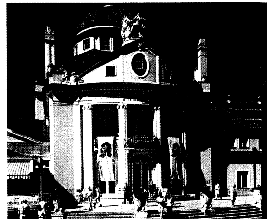
Chronische Erkrankungen der Atemwege, das Immunsystem und Tumoren bildeten die Schwerpunkte des 42. Fortbildungskongresses der Bundesapothekerkammer (BAK) in Meran. Seite 24