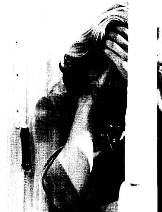
Durch die Blockade eines Neurotransmitters des Trigeminnusnervs lassen sich Migräne-Attacken mit Hilfe von CGRP-Antagonisten beenden. Wegen ihrer fehlenden Wirkung auf Koronargefäße könnte die neue Substanzklasse den Triptanen überlegen sein. Seite 25

Dieser Ausgabe liegt das PTA-Forum 5/04 bei.