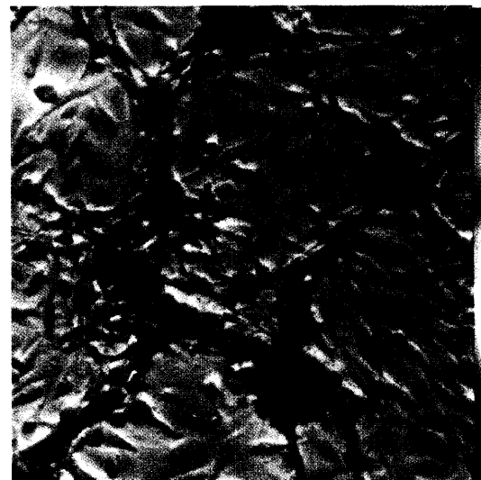
Angiogenesehemmer verhindern die Neubildung der für den heranwachsenden Tumor lebensnotwendigen Blutgefäße. In Zukunft könnten diese Substanzen bei Patienten mit bekanntem Tumorrisiko präventiv eingesetzt werden. Seite 24