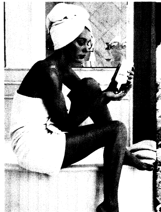
Künftig wird auf Kosmetikprodukten angegeben, welche Parfümbestandteile sie enthalten und wie lange sie nach dem Öffnen haltbar sind. So können auch Allergiker zum Beispiel Cremes mit solchen Duftstoffen benutzen, auf die sie nicht reagieren. Seite 24