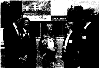
In der Schweiz betätigen sich Ärzte als Arzneimittelversender. Ihr Unternehmen drängt nun auch auf den deutschen Markt. Seite 8.

Versandhandel: Schweizerische Rosen für deutsche Patienten