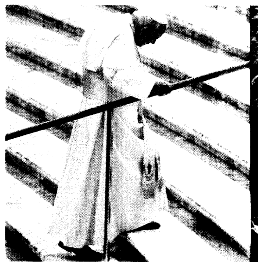
Prominenter Parkinson Patient: Papst Johannes Paul II. Goldstandard der Therapie ist nach wie vor Levodopa, doch mit zunehmender Krankheitsdauer treten Komplikationen auf. Apomorphin bietet hier einen Ausweg. Seite 22