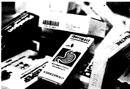
Schlechte Nachrichten für OTC-Hersteller. Die meisten nicht-verschreibungspflichtigen Arzneimittel haben es nicht auf die Ausnahmeliste geschafft. Seite 8

Ausnahmeliste: Das hat mit Rationalität nicht viel zu tun