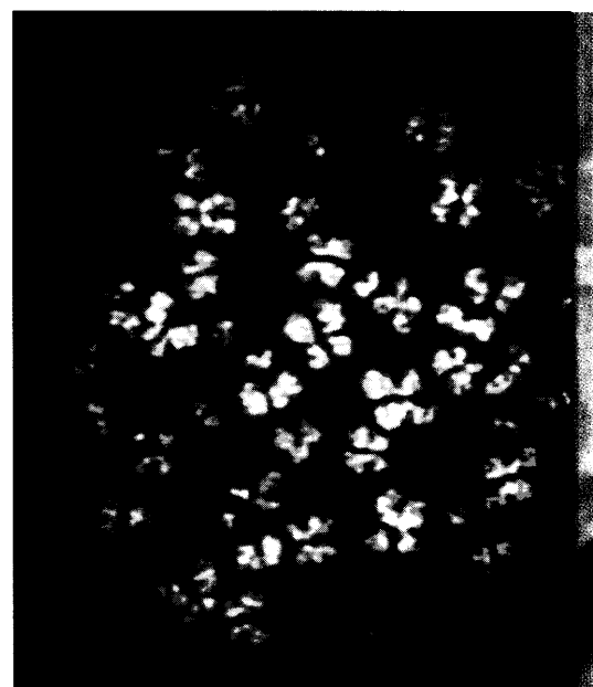
Der Tyrosinkinaseinhibitor Imatinib zeigt gute Resultate in der Behandlung der chronisch myeloischen Leukämie (CML) und gastrointestinaler Stromatumoren (GIST). Die Euphorie trüben jedoch vermehrte Resistenzbildungen. Seite 30