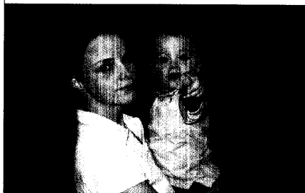
Kindersegen im Studium: Pharmaziestudenten mit Kind berichten über ihre Erfahrungen und erzählen wie sie die Doppelbelastung unter einen Hut bekommen. Seite 59