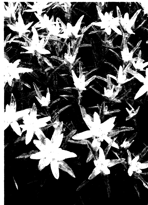
Einheimische Flora als Fundgrube: Innsbrucker Wissenschaftler entdeckten im Edelweiß anti-inflammatorisch wirksame Verbindungen. Seite 30