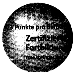
Jetzt 3-fach punkten ▶ Seite 849