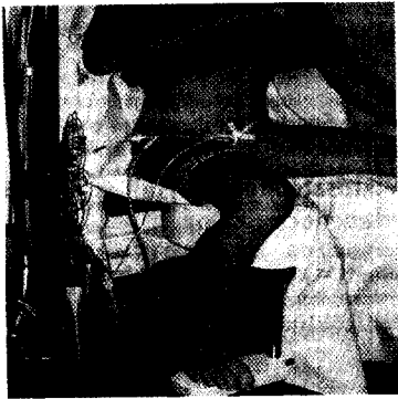
Videourodynamik beim Kind mit suprapubischer Messung ▶ Seite 783