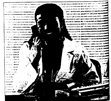
Haftpflicht in der Arztpraxis: Umfassende Information ist unerlässlich.