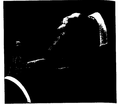
Medizinische Versorgungszentren: Kooperationsform der Zukunft?