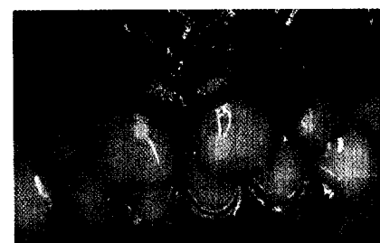
Ästhetische Frontzahnversorgung im Milchgebiss. C. Beyer