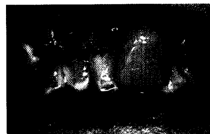
Klinischer Ausgangsbefund. J. Becker et al.