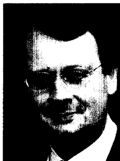
Wolfgang Pföhler, Präsident der Deutschen Krankenhausgesellschaft (DKG)

Die Internet-Seite des „Instituts für das Entgeltsystem im Krankenhaus“ (InEK gGmbH) bietet übersichtlich geordnete und aktuelle Informationen zum aktuellen Stand der Einführung des deutschen DRG-Systems und damit zu einem sehr wichtigen Sachgebiet der täglichen Krankenhausarbeit.