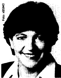
Ulla Schmidt, Bundesministerin für Gesundheit u. Soziale Sicherung (SPD)