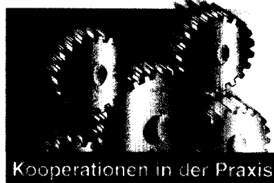
Kooperationen in der Praxis

Die Berechnung des Erlösausgleichs nach KHEntgG ist komplex. Der Krankenhauszweckverband Köln, Bonn und Region hat für seine 115 Mitgliedskrankenhäuser ein Ausgleichs- und Berechnungs-Schema entwickelt. Seite 452