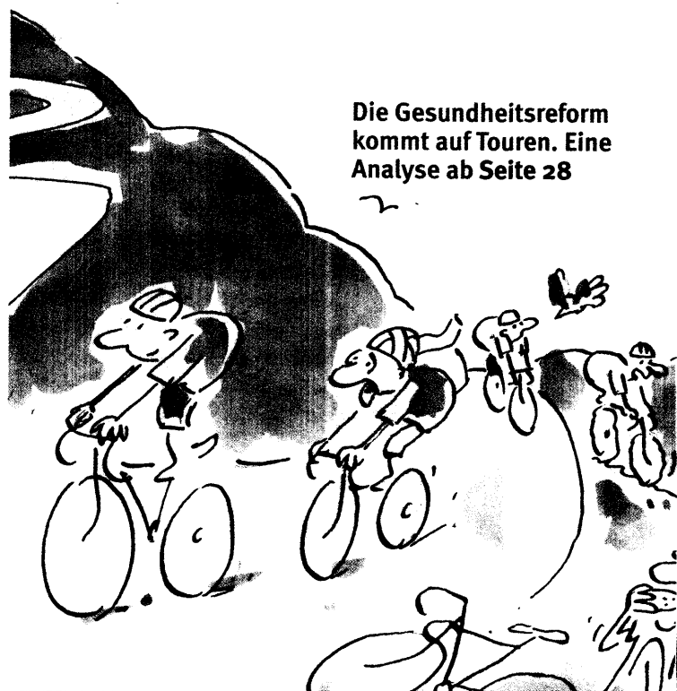
Die Gesundheitsreform kommt auf Touren. Eine Analyse ab Seite 28