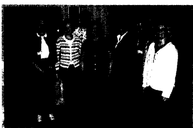
Titelbild: © Kirchheim-Verlag, Mainz