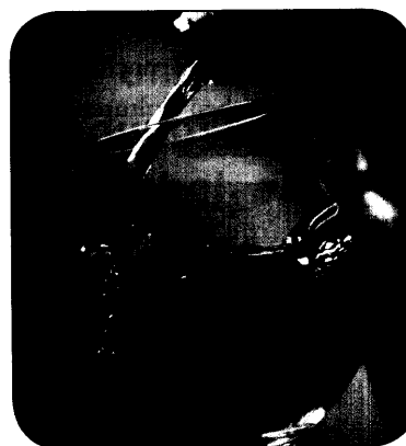
Wein enthält Substanzen, wie zum Beispiel Phenole, denen protektive Eigenschaften auf die Gesundheit zugeschrieben werden.