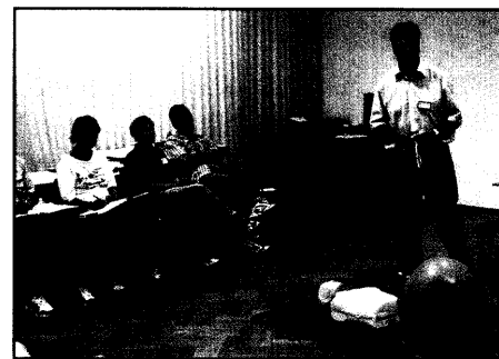
Anforderungen an das Rettungsfachpersonal