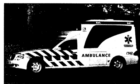
Rettungsdienstmesse in den Niederlanden