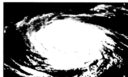
Notfallmedizin während Hurrikans