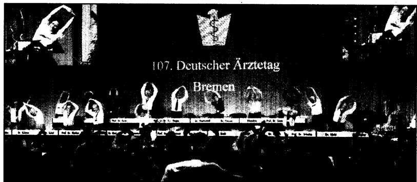
„Ärzte in Bewegung“ – der Vorstand der Bundesärztekammer...