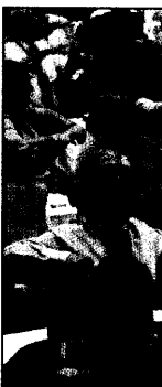
... und die Delegierten