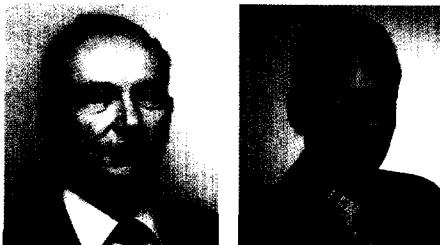
M&M-Autor: Eberhard W. Eckert Neuer Autor: Dr. Peer Lange