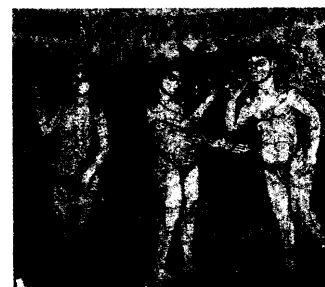
Adam und Eva. Mosaik aus der Kirche San Marco in Venedig.