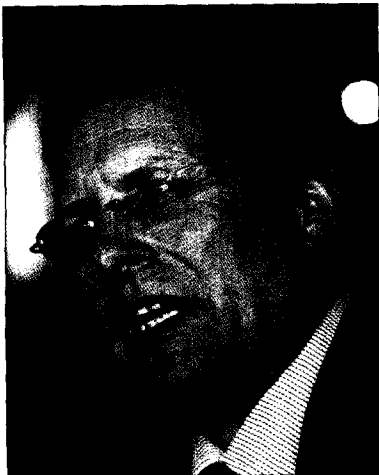
Prof. Dr. Dietrich Grönemeyer