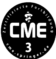
Jetzt 3-fach punkten ▶ Seite 1435