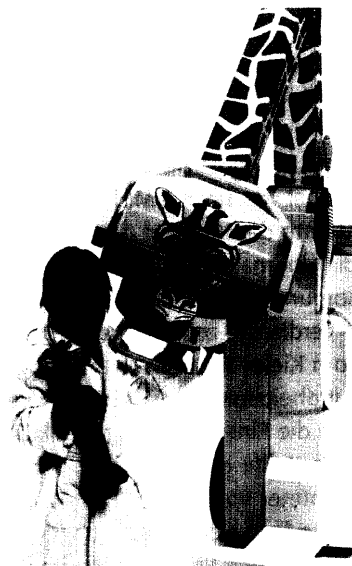
Auf unseren Produktseiten finden Sie wieder Neues für Pflege und Therapie.

Die Geschichte der Medizintechnologie – Teil 3 72