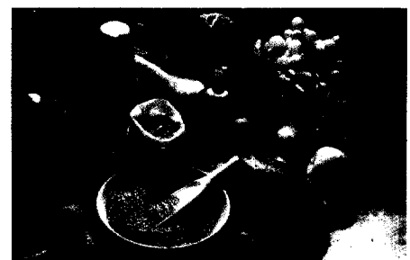
Vitamine & Co