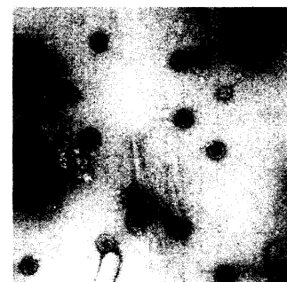
Noroviren in Stuhl, Negativ-Kontrastierung mit 1% UAc.