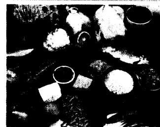
Mittelmeerdät: gesunde, leckere Zutaten auf dem Speiseplan.