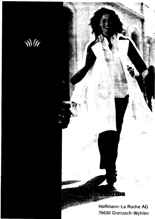
Hoffmann-La Roche AG 79630 Grenzach-Wyhlen