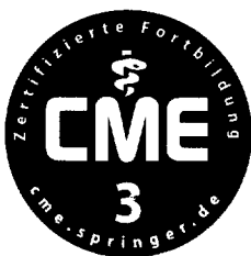
Jetzt 3-fach punkten ► Seite 1309