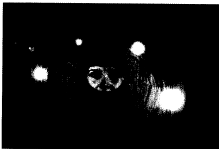
Depression & Energie