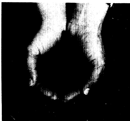
Infektion & Preiselbeere