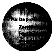
Jetzt 3-fach punkten ► Seite 1013