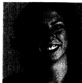
Vier junge Abgeordnete im Porträt ab Seite 28