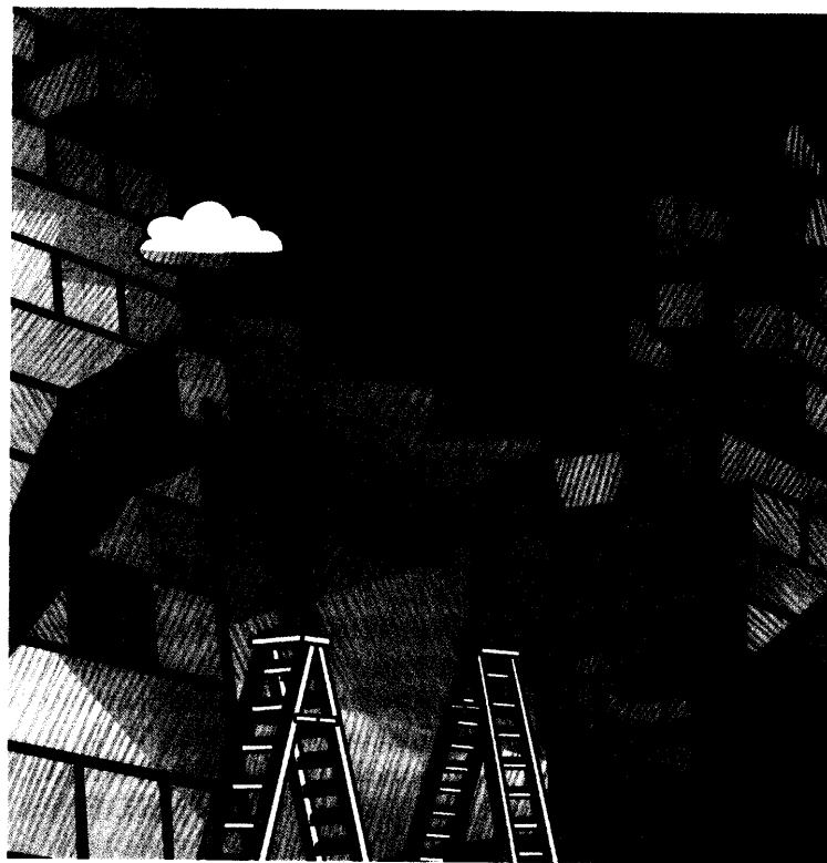
Ansichten über die Baustelle Kassen-Finanzierung ab Seite 20