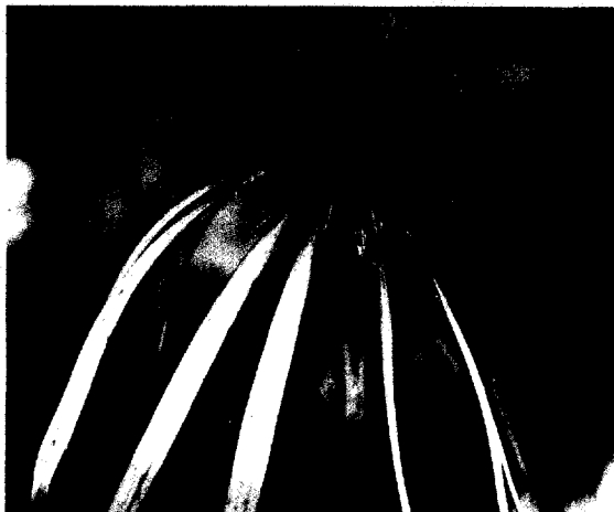
Seite 103 Vom Schmalblättrigen Sonnenhut ( Echinacea angustifolia ) werden Wurzel-extrakte und Presssaft zur Phytotherapie der Rhinitis eingesetzt

Besik Kukurievitch Shamugiya Antihomotoxika zur Behandlung akuter und chronischer viraler Hepatitiden Antibomotoxic therapy of acute and chronic viral hepatitis ..... 120