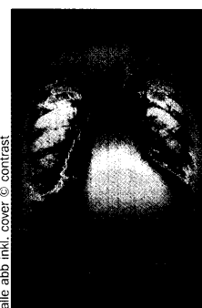
alle abb. inkl. cover © contrast

In den letzten Jahren wird die Diagnose Herzinsuffizienz immer häufiger gestellt. So erlebte beispielsweise in der „Framingham-Studie“ nur jeder zweite Patient mit leichter Herzinsuffizienz das fünfte Jahr. State of the Art und DFP-Literaturstudium. Seite 36