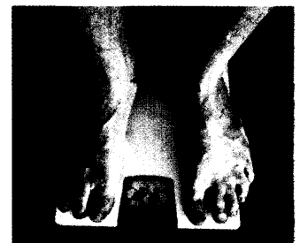
Die überflüssigen Pfunde sind weg nach Fettabsaugen, nicht aber die metabolischen Komplikationen der Adipositas.