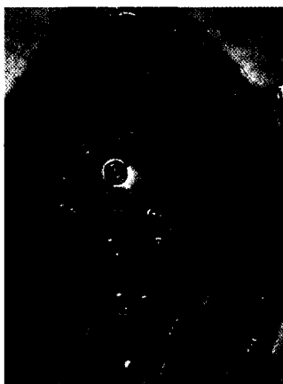
Die Erfahrungen mit einem winkelstabilen Plattenfixateur und zusätzlicher Fadenzuggurtung bei 35 dislozierten 3- und 4-Fragment-Frakturen des proximalen Humerus werden beschrieben. ► Seite 769