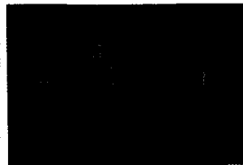
Patient mit einem dysplastischen Nävus-Syndrom