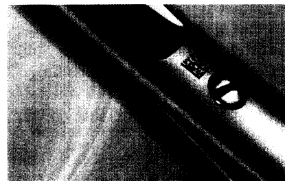
Mit dem Data-Matrix-Code kann eine große Informationsmenge auf kleinster Fläche codiert werden. Damit eignet er sich für dauerhafte Direktbeschriftung medizinischer Instrumente.