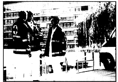
Diskussionsstoff: Arbeitszeit im Rettungsdienst