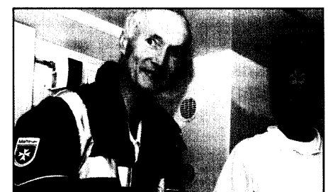
Ein Prinz auf dem RTW