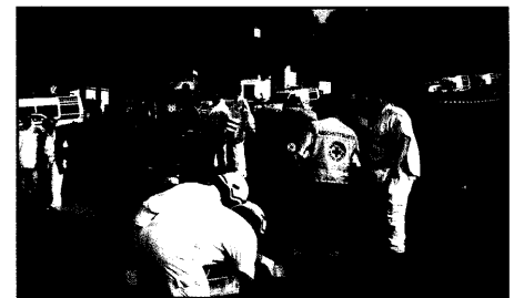
Einsatz bei schwerem Busunglück in Hallein