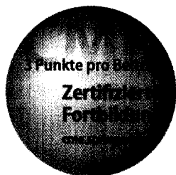
Jetzt 3-fach punkten ► Seite 1061