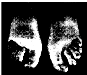
Krallenzehnen bei Diabetes mellitus ► Seite 978

Diabetic neuropathic osteoarthropathy of the knee joint. A rare but increasing complication – case report