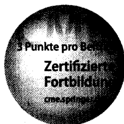
Jetzt 3-fach punkten ► Seite 677