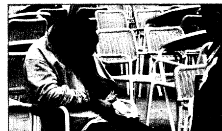
Einsatz für den Rettungsdienst ? Teil II: Der "hilflose" Betrunkene