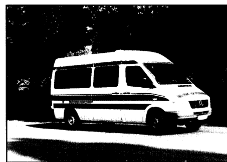
Einfache Krankentransporte - Kein Einsatz für den Rettungsdienst SEITE 6

"Touareg on the rocks" 31 KTW VW T5 von W.A.S. "Der Schienenbus" 32