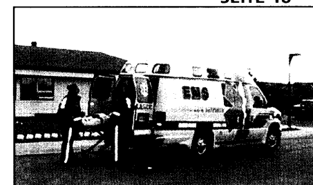
Rettungsdienste in Kanada