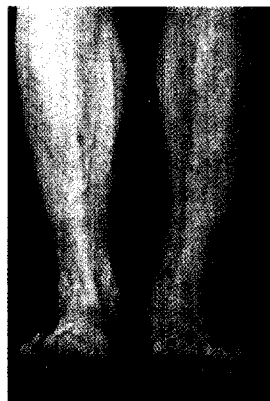
Grad I offene C2.2-Fraktur des Pilon tibiale, Erstversorgung am Unfalltag mit einer Ilizarov-Hybridkonstruktion, gutes funktionelles Ergebnis und völlige Beschwerdefreiheit nach 20 Monaten ▶ Seite 273