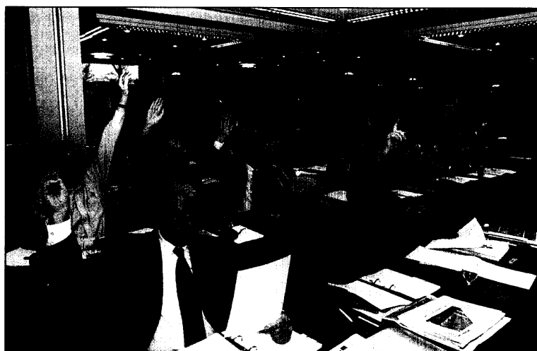
Bei der 9. Vertreterversammlung der Kassenzahnärztlichen Vereinigung Nordrhein wurden am 20. März 2004 in Düsseldorf bei den Abstimmungen über Anträge und Resolutionen viele Hände zustimmend gehoben. Als es um die Vorbereitung der „neuen“ KZV nach den Forderungen des GKV-Modernisierungsgesetzes ging, ballte mancher allerdings die Hand in der Tasche zur Faust.