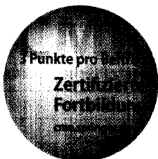
Jetzt 3-fach punkten ▶ Seite 389