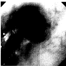
Perforiertes Ösophaguskarzinom. ► Seite 384–399