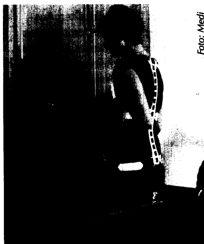
Eine Rückenorthese verbessert in vielen Fällen die Lebensqualität bei Osteoporose.

Therapienachweis für Orthese bei Osteoporose 35