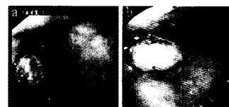
Endoskopischer Aspekt des Fremdkörpers proximal der gastroösophagealen Anastomose.