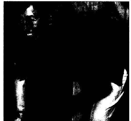
Wie minimalinvasive Hüftgelenksbehandlungen die Lebensqualität verbessern.