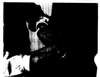
Treibt den Blutdruck manchmal in die Höhe: der sog. „Weißkitteleffekt“ bei Blutdruckmessung durch den Arzt.

1006 Iatrogenic perforation of the esophagus during transesophageal echocardiography – a rare cause of dysphagia